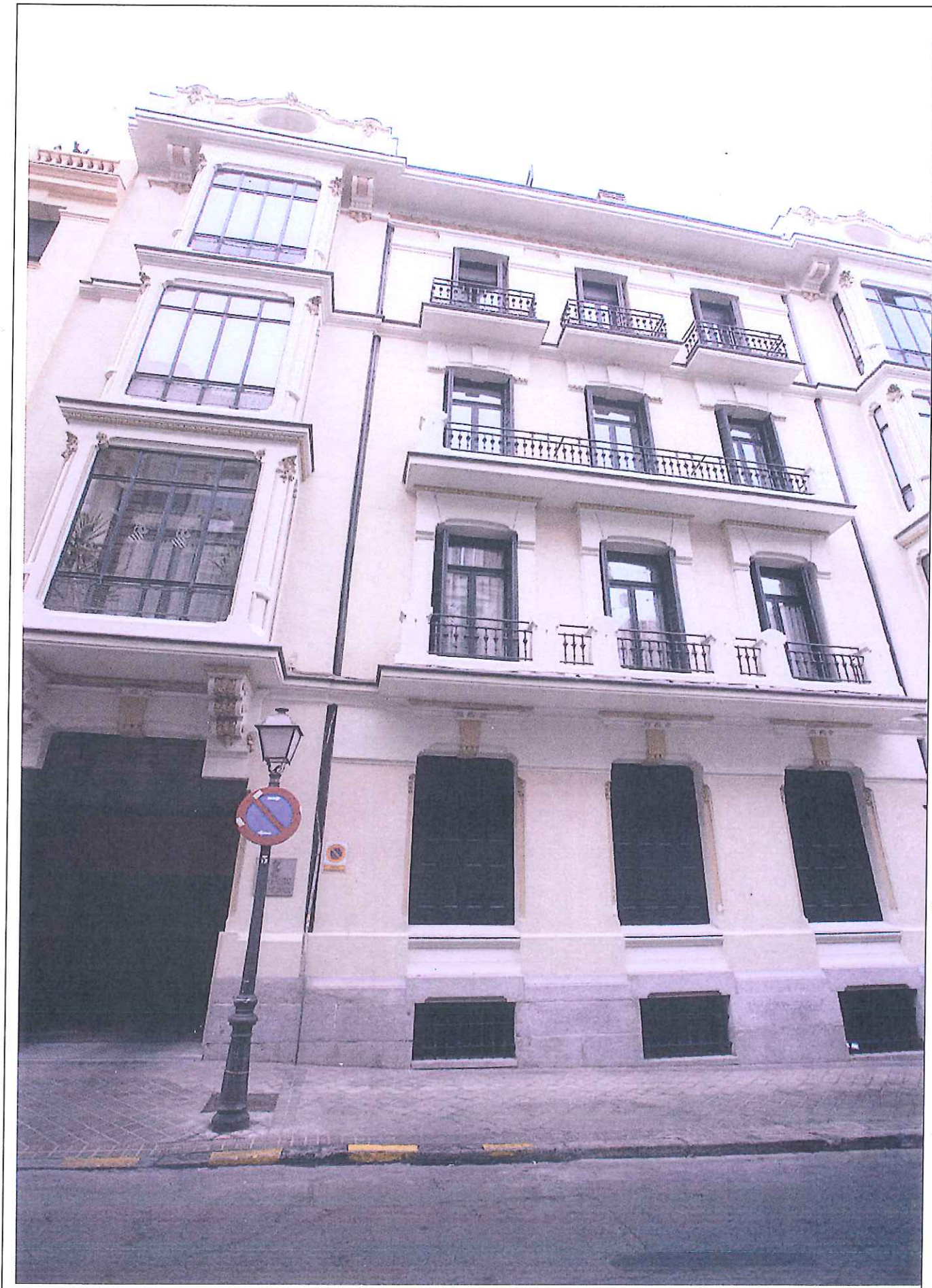
INMUEBLES PATRIMONIALES PREVISTOS PARA ENAJENAR